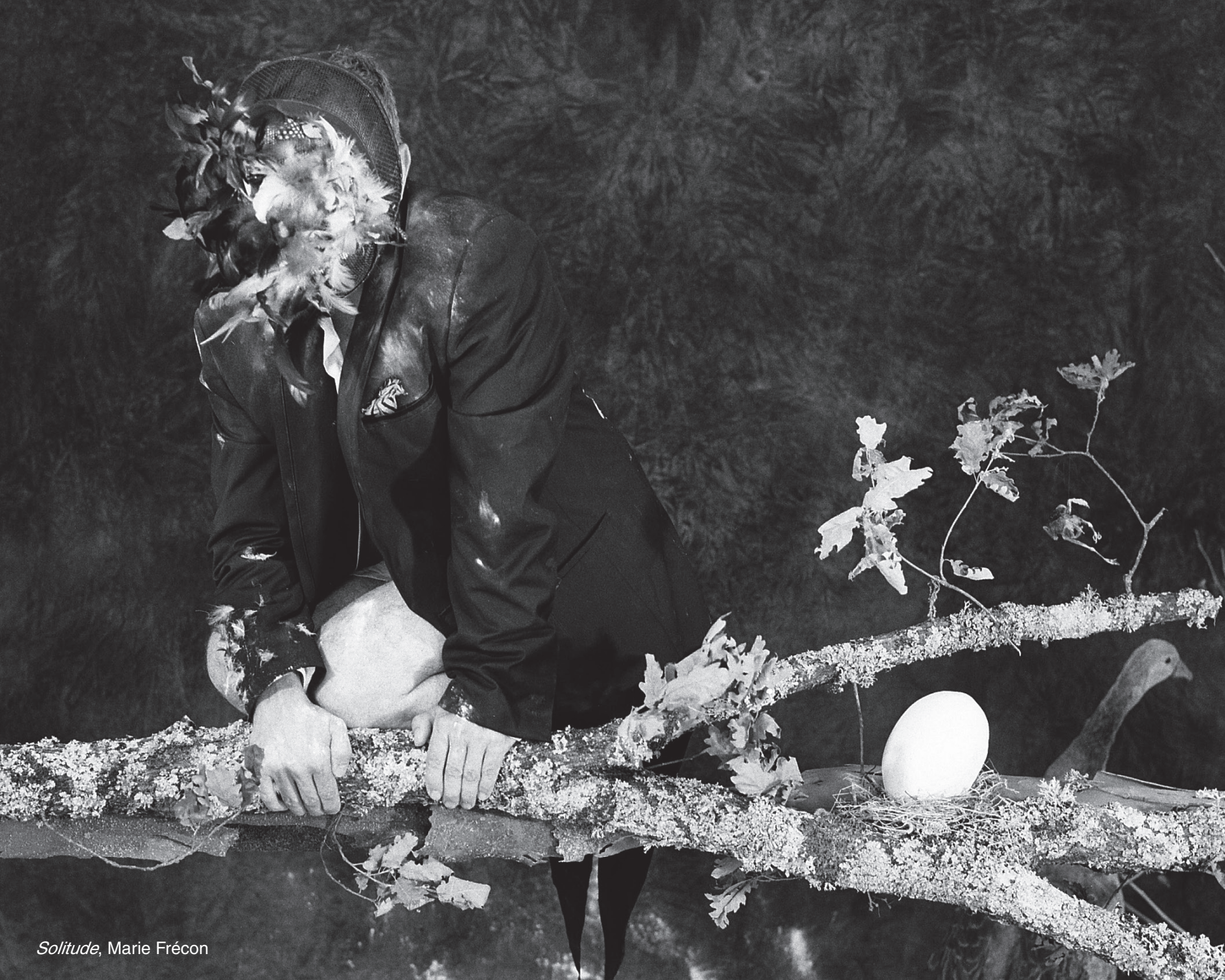
Solitude , Marie Frécon