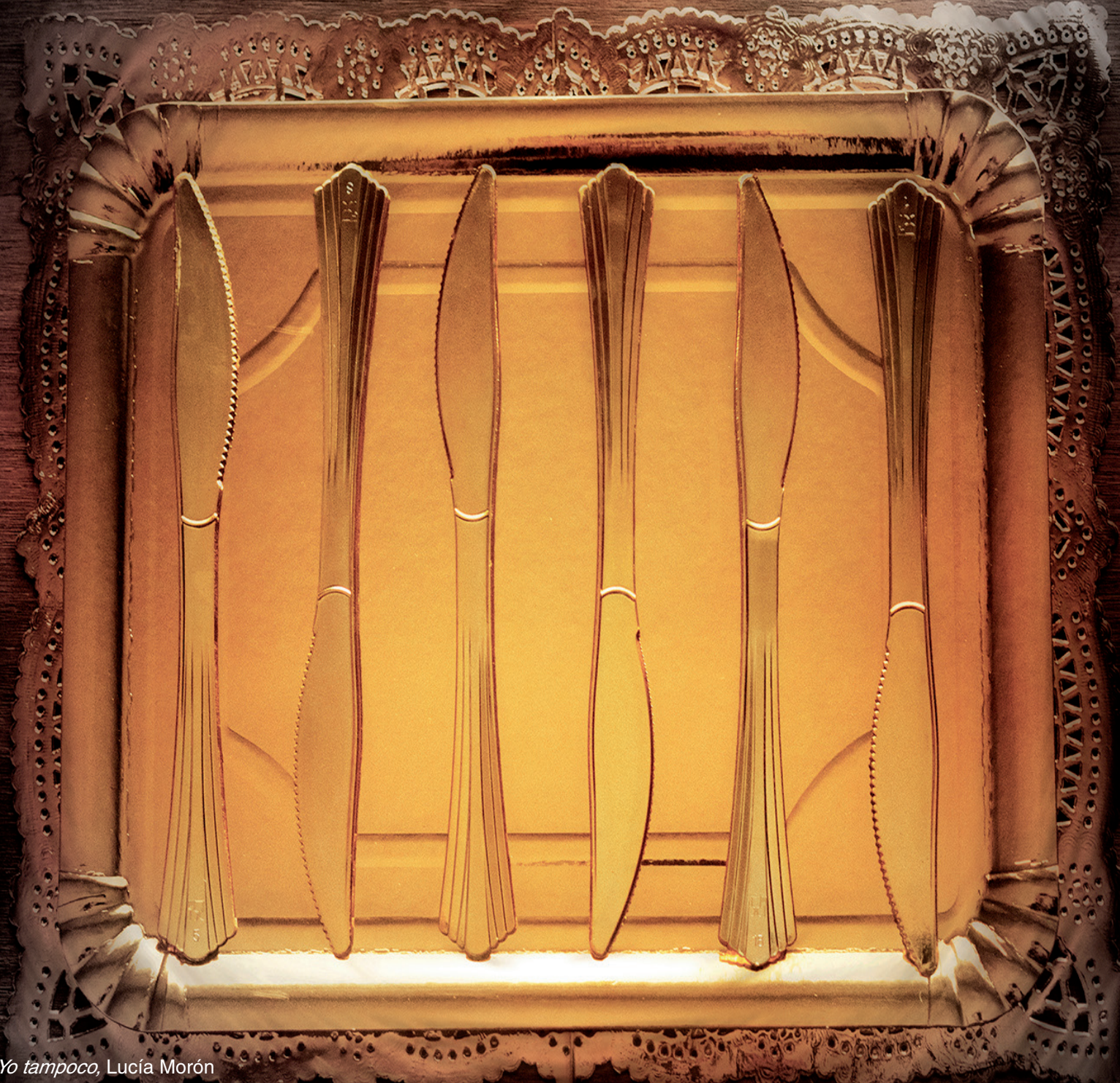
Te amo. Yo tampoco, Lucía Morón